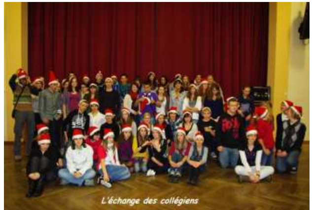
L'échange des collégiens