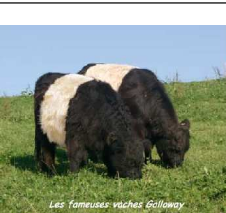
Les fameuses vaches Galloway