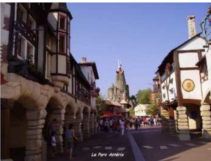
Le Parc Astérix