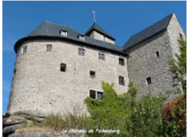
Le château de Falkenberg